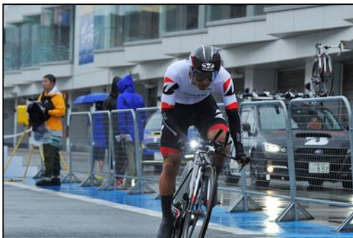
男子E タイムト・ライアル