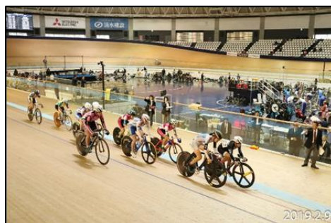
第3戦 女子エリートオムニアム