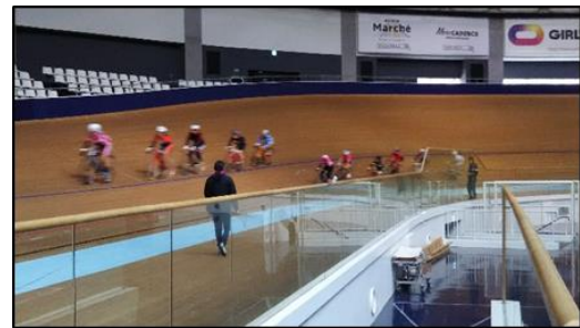
沼部コーチの指導