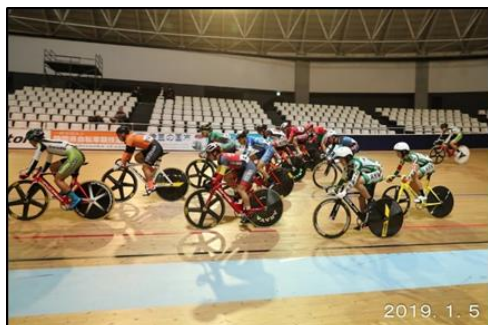
第2戦 男子ジュニアオムニアム