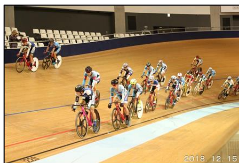
第1戦 男子エリートオムニアム