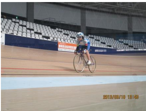
500mタイムトライアル（中学生）